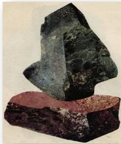
Мал.. Приклади імітації фактур тканини та каміння.

Весь спектр фактури умовно можна поділити на рельєфну, дрібно-рельєфну, шорстку і гладку. Рельєфну фактуру мають твори з гостро вираженою пластикою поверхні, наприклад, плетені вироби з лози, рогами, соломі тощо. Дрібно-рельєфна фактура характеризується слабо вираженою пластикою поверхні. Сюди відносять ткани, в'язані, вишиванні твори. Шорстку фактуру мають здебільшого не шліфовані вироби з дерева, металу, каменю. Гладку фактуру мають поверхні твердих матеріалів після шліфування, полірування, лакового покриття. Наприклад, поліровані поверхні деяких виробів з дерева, каменю і металу. Поверхня з гладкою фактурою залежно від чистоти обробки буває матовою, напів-матовою і дзеркальною.