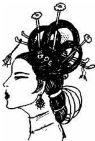
Рис. 6. Святкова зачіска китайської імператриці

Святкова зачіска імператриці складалася з об'єму збитого волосся, зачесаного догори. На потилиці випускали короткі пасма, зверху прикріплювали квітку, а по колу прикрашали зачіску стрічками, пучками ниток, перлами.