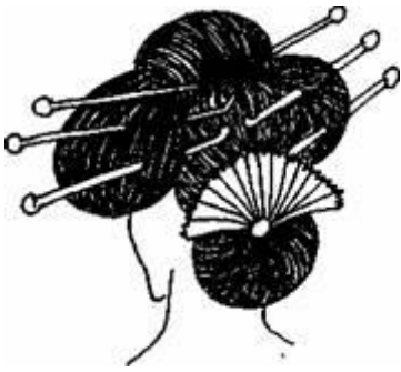
Рис. 8 Зачіска японської гейші

Високі складні зачіски носили жінки з вищої знаті, які у святкових випадках покривали волосся фіолетовим напиленням. Щоб отримати справжні витвори мистецтва, перукарі годинами чаклували, споруджуючи вигадливі башти з волосся. Такі зачіски створювали на декілька днів і навіть тижнів.