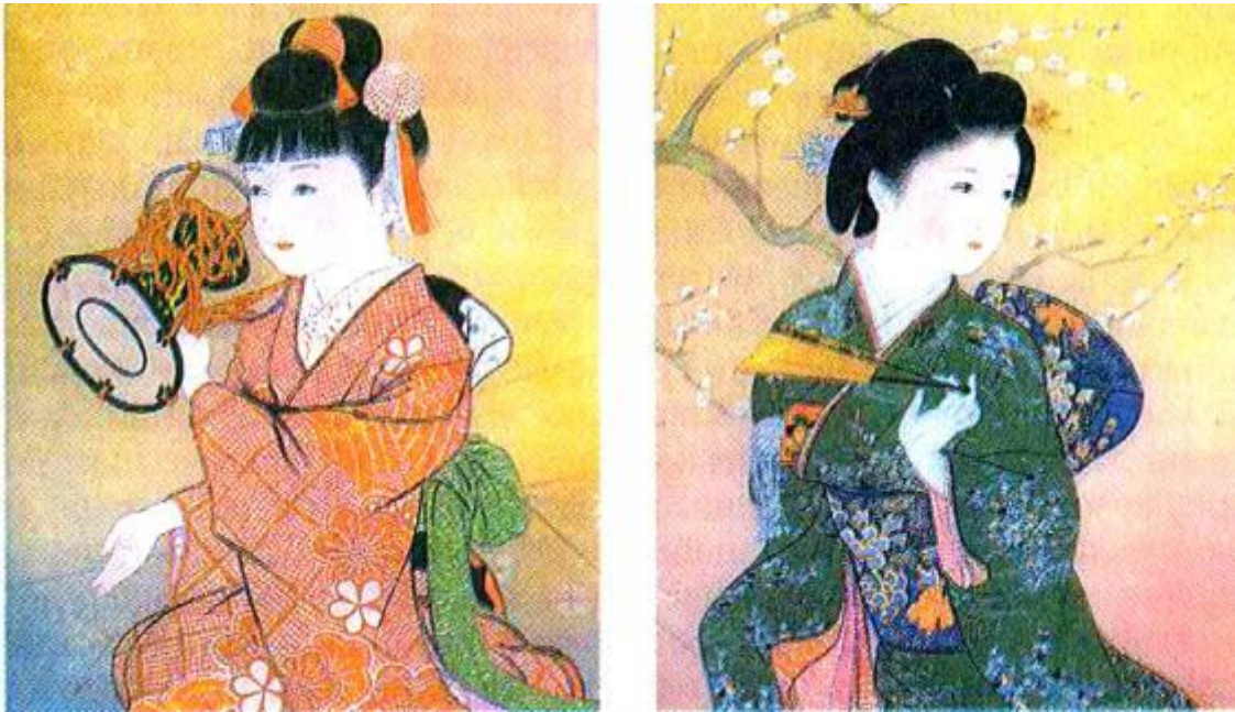
Рис. 12. Дитячі зачіски

Серед чоловіків — представників знатної верхівки — особливо популярними були щіткоподібні зачіски різних варіантів. Деякі чоловіки обмежувалися оформленням щітки тільки в тім'яній зоні, а зі скронь і потилиці збирали подовжене волосся на маківці у вигляді петлі, підв'язуючи стрічкою (рис. 10,11).