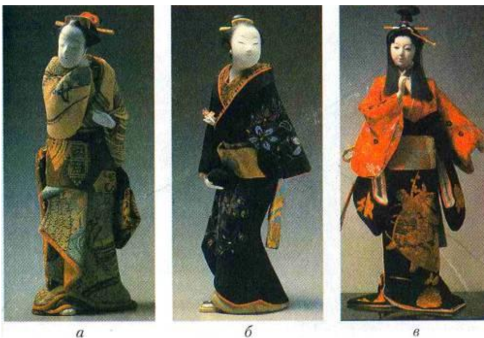
Рис. 7. Японські національні зачіски:

Більшість створеного в межах японської культури можна назвати мистецтвом. Жіноча мода — не виняток. Нанесення гриму вважалося знаком поваги де старших осіб, наділених владою. Для дами з'явитися перед батьком або чоловіком ненабіленою, ненарум'яненою, із зубами, не пофарбованими у чорний колір, вважалося непристойним. Жіночі зачіски виконували з довгого прямого, жорсткого, чорного волосся. Характерна риса їх — комбінація об'ємів, спрямованих догори, складність, симетрія. В середині об'єми заповнювали чорними оксамитовими валиками, наповненими сухою травою. Спеціальні шпильки, стрічки, гребені, зроблені з дерева, дорогоцінних металів, коралів, панцира черепахи, слугували кріпленням для зачісок. Зовні зачіски нагадували китайські, але їхні відмітні риси — відсутність асиметрії, чілок, проділів (рис. 7. а, б, в).