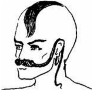
Рис. 7.9. Зачіска «чуб» доповнена вусами

Найдавнішим видом головного убору чоловіків, як за формою, так і за матеріалом, була шапка. Цей головний убір зберігся і донині. На території всієї України відомі були також високі циліндричні, півсферичні або конусоподібні шапки з овчини або іншого хутра — «кучма», «капуз». Гуцули носили чорні фетрові капелюхи, дно яких обводили золотистим галуном, узорною бляхою («басман») або різнокольоровими шнурками («байорками»).