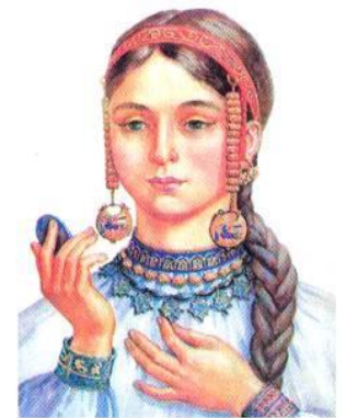
Рис. 7.3. Зачіска та прикраси дівчини часів Київської Русі (малюнок-реконструкція О. Мінжуліна)

Регіональні особливості яскраво проявлялися у святкових зачісках. Практичність зачісок поступалася місцем естетичній функції. Святкові зачіски дівчата намагалися робити складними, гарними, ошатними, але при цьому суворо дотримувалися традицій свого регіону.