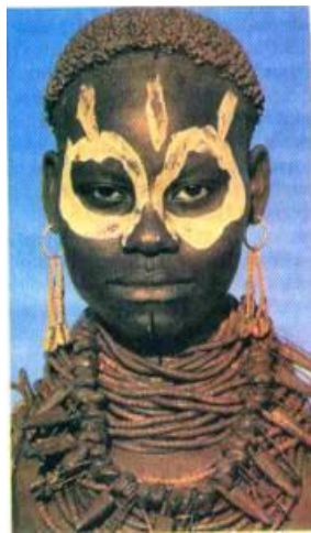
Рис. 7.57. Прикраси жінок племен малинке (Малі) прикраси, зачіска та розмальовування шкіри

Рис. 7.58. Жіночі святкові прикраси, зачіска та розмальовування шкіри