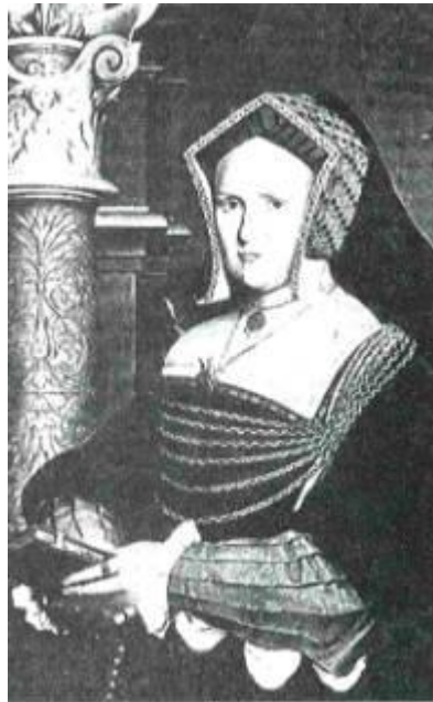
Рис 2.40. Головний убір у стилі «гейбл»

До головних уборів кріпили вуалі. Наприкінці XVI ст. серед прикрас для волосся з'являються гребінці й наколки — блонди (чорні мережива, прикріплені на потилиці та з боків зачіски), які м'яким драпіруванням спускалися на плечі й спину. «Коф'я де папос» — національний головний убір іспанок із білого полотна — закладався дрібними складками і був поширений у XVI ст.