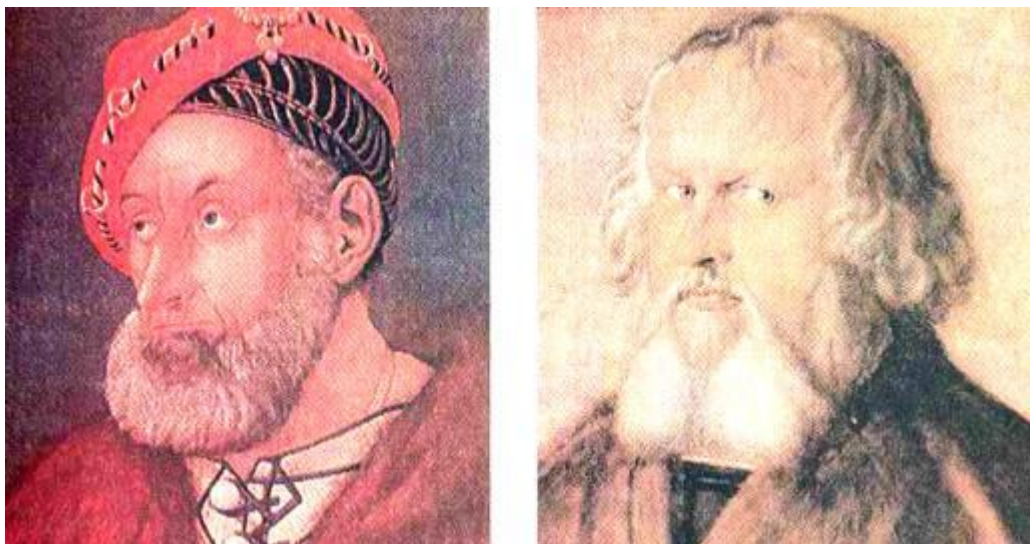
Рис. 2.32. Бороди: