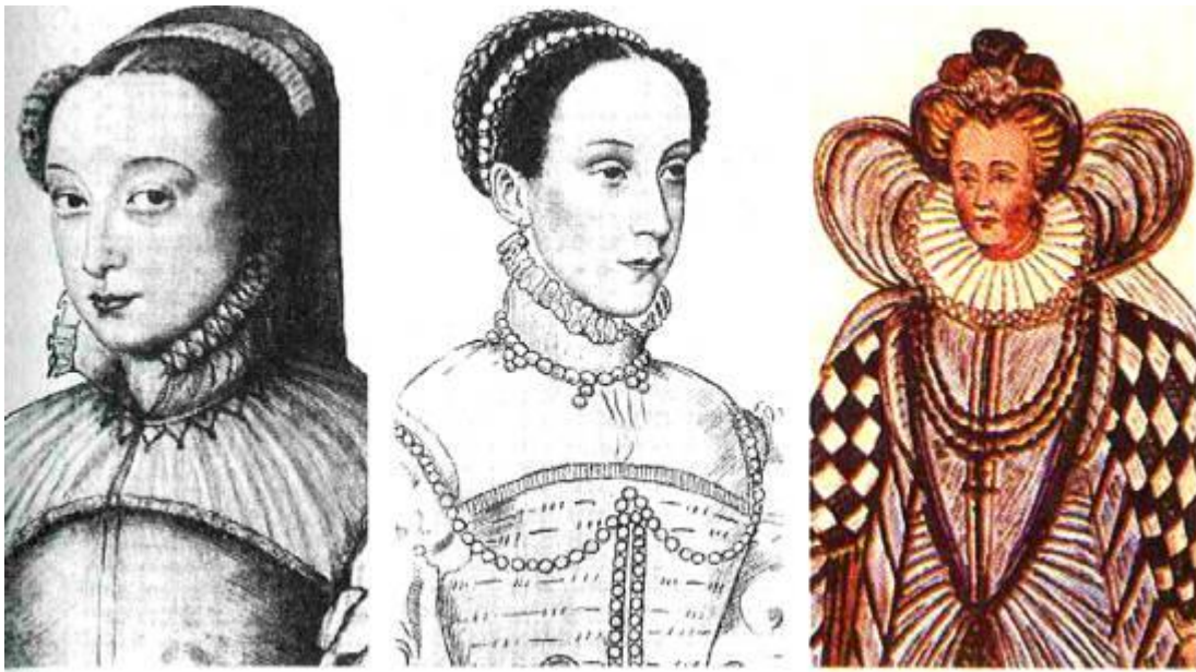
Рис. 2.44. Катерина Медичі, дружина Генріха II (малюнок роботи невідомого олівцем Ф. Клуе) художника

золотий обруч з перлами, за ним другим ярусом укладена коса золотавого кольору (рис. 2.45).