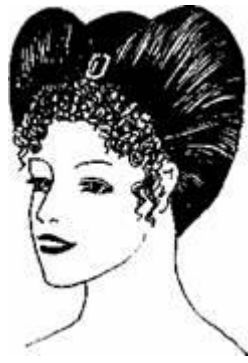
Рис. 2.37. Зачіска з валиком у формі серця

Спочатку були поширені досить плоскі зачіски з прямим проділом або без нього, із завитими пасмами по всій голові, укладені хвилями (ондуляція, рис. 2.36 я), а також укладеними паралельними рядами чи у вигляді валиків на скронях (рис. 2.36 б).