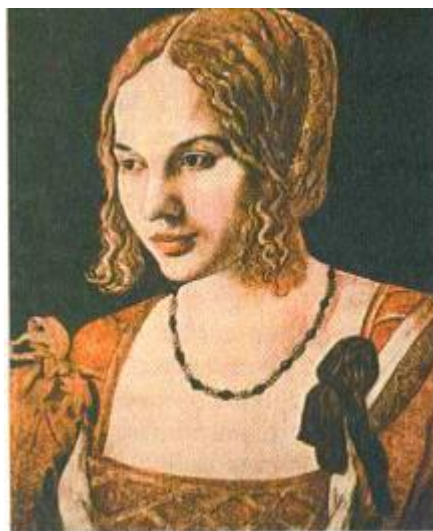
Рис. 2.28. Вплив італійської моди на жіночі зачіски Німеччини (А. Дюрер «Венеціанський портрет молодого чоловіка», 1506)

З подібними зачісками зображені імператор Максиміліан на картині А. Дюрера, Боніфаций Амербах з портрета роботи Г. Гольбейна, молода людина з портрета пензля А. Гольбейна.