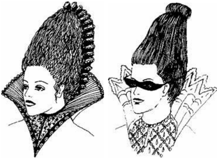
Рис. 2.38. Висока, конусоподібна зачіска геометричних фігур у зачісці Рис. 2.39. Варіант об'ємних зачісок