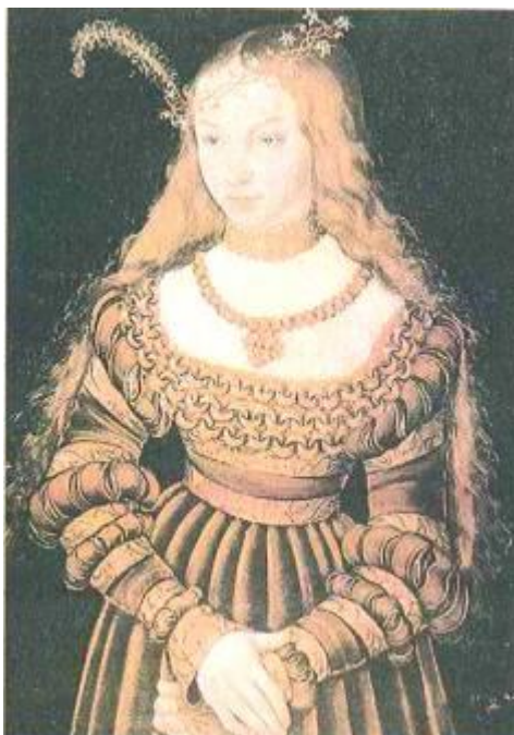
Рис. 2.29. Зачіска німецької дівчини кінця XVI ст. (Л. Кранах Старший. Портрет Сибілли Кревської, 1526)

Іспанія. Суворе дотримання церковних указів в Іспанії наклало відбиток на всі види мистецтва і передусім позначилося на моді.