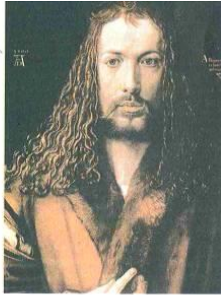
Рис. 2.30. Чоловічі зачіски у Німеччині в добу Відродження:

а — А. Дюрер. Автопортрет (1498); б — А. Дюрер. Автопортрет (1500)