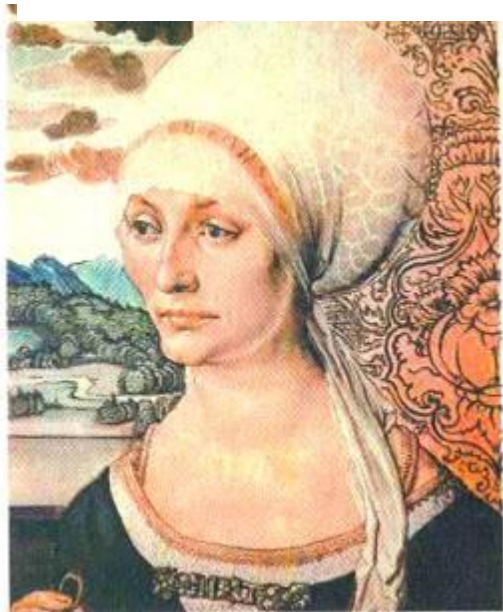
Рис. 2.27. А. Дюрер. Портрет Ельсберт Тухер

На портретах Сибілли, Емілії та Сидонії Саксонських художник тільки Сибілли намалював без головного убору, її коси гарно заплетені й укладені зверху від скроні до скроні. Декілька вільних пасом випущені з-під плетінки. Над чолом, у вигляді обідка, паралельно косам, прикріплено стрічку з перлами (рис. 2.26 б).