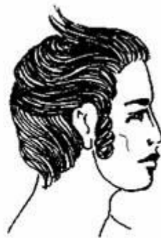
Рис. 2.31. Іспанські мотиви у європейській моді початку XVI ст.: