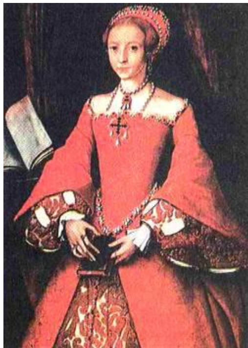
Рис. 2.41. Французькі мотиви в моді

закріплення зачіски перукарі застосовували баранячий жир, яєчні жовтки, ароматичні помади й олії. Жінки широко користувалися косметичними засобами. Для відбілювання на шкіру наносили креми, пасти, застосовували помаду, парфуми. В останній чверті XVI ст. іспанські аристократки почали надягати на обличчя маски для захисту шкіри від сонця. Поступово маски стали дуже популярними, і вже вважалося непристойним для жінки виходити на вулицю без маски або півмаски. Крім того, маска надавала обличчю деякої загадковості, таємничості, що дуже подобалося жінкам.