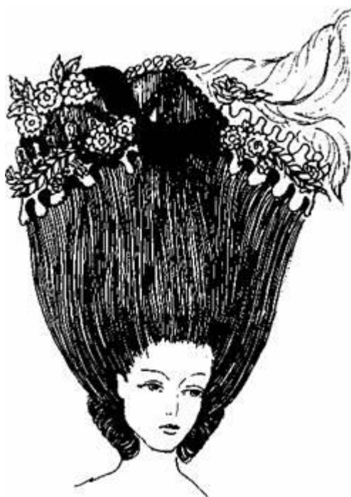
Рис. 3.12. Зачіска з великими, овальними, гладенькими формами зі збитого волосся

Пізніше, в 30-ті роки XVIII ст., з'явився новий силует зачіски. Великі, Овальні, гладенькі, створені зі збитого волосся