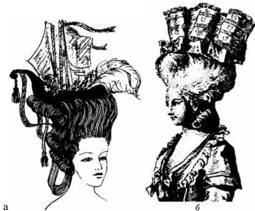
Рис. 3.14. Зачіска типу «фрегат»:

а — зачіска з моделлю фрегата, доповнена стрічками, пір'ям, квітами;