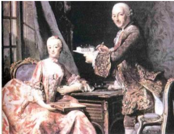
Рис. 3.11. Зачіска «мала пудрена»

За часів Марії-Антуанетти в Парижі було засновано Академію перукарського мистецтва. Тоді у моді переважала висока зачіска на каркасі (до 70-80 см заввишки), яку називали «куафюра». Таку зачіску прикрашали мереживом, пір'ям, перлами, стрічками й іншими аксесуарами. Своє мистецтво в оформленні зачісок виявляли справжні художники-перукарі (Легре, Леонар, Антуан, Даже та ін.) У Парижі куафер короля Людовика XV метр Легре створив Академію перукарського мистецтва, яка готувала спеціалістів-куаферів.