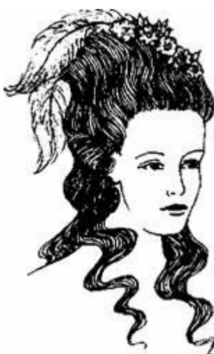
Рис. 3.15. Зачіска принцеси Ламбаль

Зверху зачіску прикрашали бантом і стрічками, доповнювали квітами, розміщеними асиметрично. Зачіска мала величезний успіх; було розроблено велику кількість її варіантів (рис. 3.15).