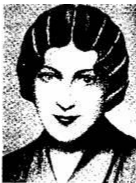
Рис. 5.8. Зачіски з хвилями і валиками: