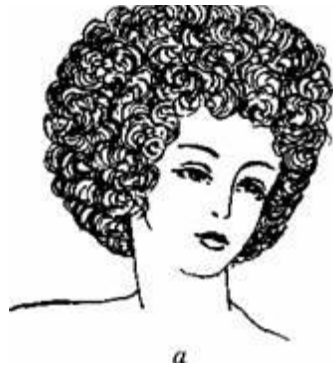
Рис. 5.7. Зачіски 30-х років ХХ ст.: а — перманент; б — варіант «російської» зачіски

У 30-ті роки чоловіки віддавали перевагу голеному обличчю. Лише чоловіки «елегантного віку» дозволяли собі носити невеликі бороди овальної або загостреної