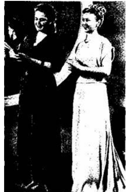
Рис. 5.12. Популярні зачіски післявоєнного часу

У 40-ві роки ХХ ст. з'явився лак для волосся, що значно розширило можливості перукарів створювати нові зачіски, втілювати творчі фантазії й певним чином вплинуло на поширення конкурсних змагань.