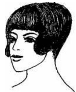
Рис. 5.4. Варіант зачіски «фокстрот»

Чоловічі зачіски практично не змінилися. Коротка стрижка була найпопулярнішою. Деякі чоловіки доповнювали зачіску вусами. З'явилися «вуса бюрократа»: над верхньою губою формували невеликий квадрат із короткого волосся. Зустрічалися короткі вуса із закрученими догори кінцями. Втратила колишню популярність борода, хоча серед інтелігентів можна було побачити невеличку борідку.