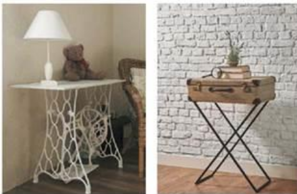
Мал. 2. Нове життя старих речей