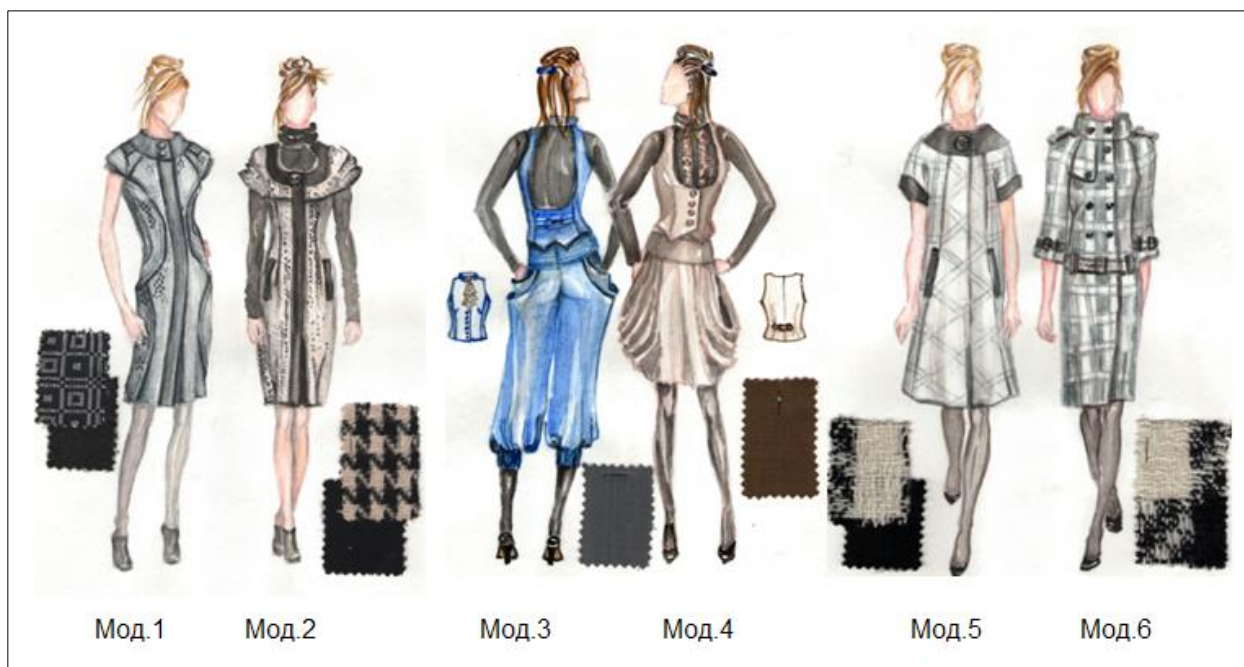
Приклади малюнків моделей одягу