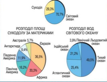
СУХОДІЛ ТА СВІТОВОГО ОКЕАНУ