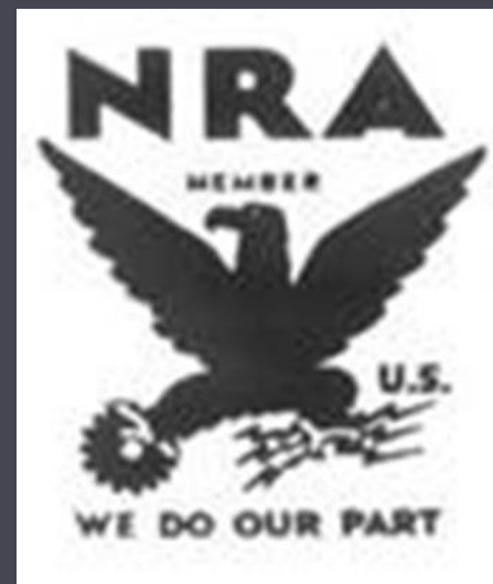
Символ „Нового курсу”