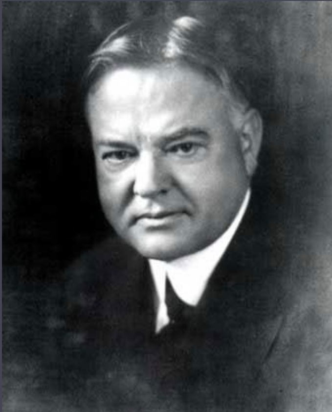
Президент США Г. Гувер (1929–1933 рр.)