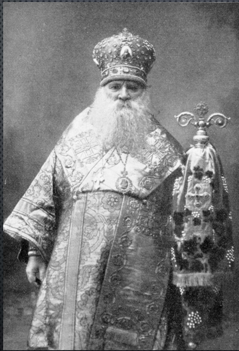
Митрополит Василь Липківський