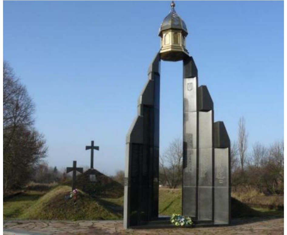
Меморіал пам'яті Героїв Базару