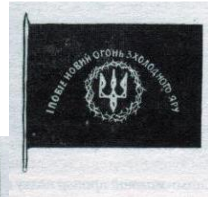
Малюнок прапора Холодного Яру