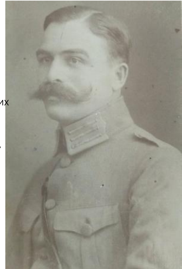
Фото Андрія Гулого-Гуленка в 1921 році