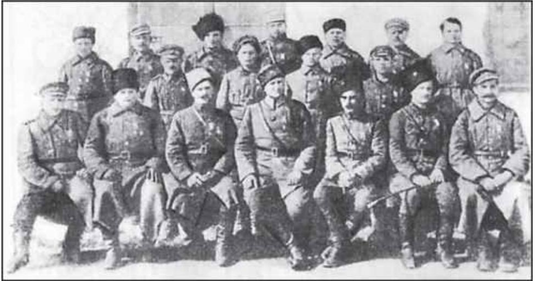
Група учасників Другого Зимового походу перед виїздом в Україну. Вересень 1921-го