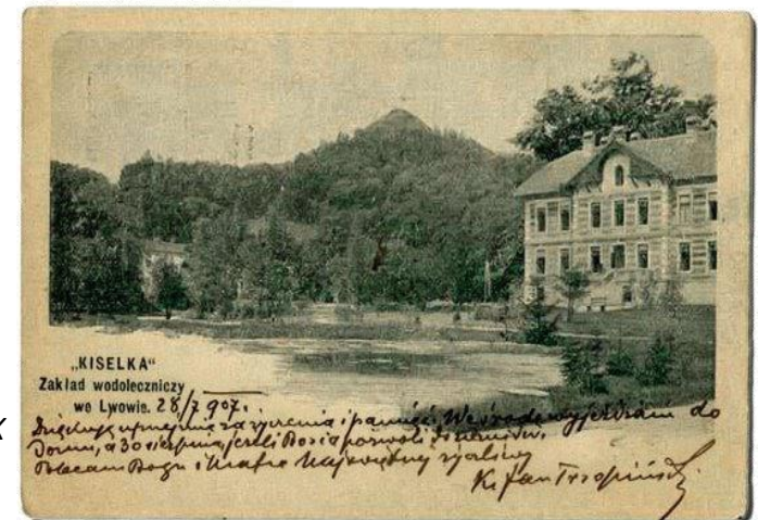
Фото санаторію "Кіселька" на Підзамчі під Львовом, де 1921-го розміщувалася польська розвідка і ППШ. Сюди прибували сотні розвідників і зв'язкових від повстанських організацій. Тепер тут львівський завод "Галичфарм".