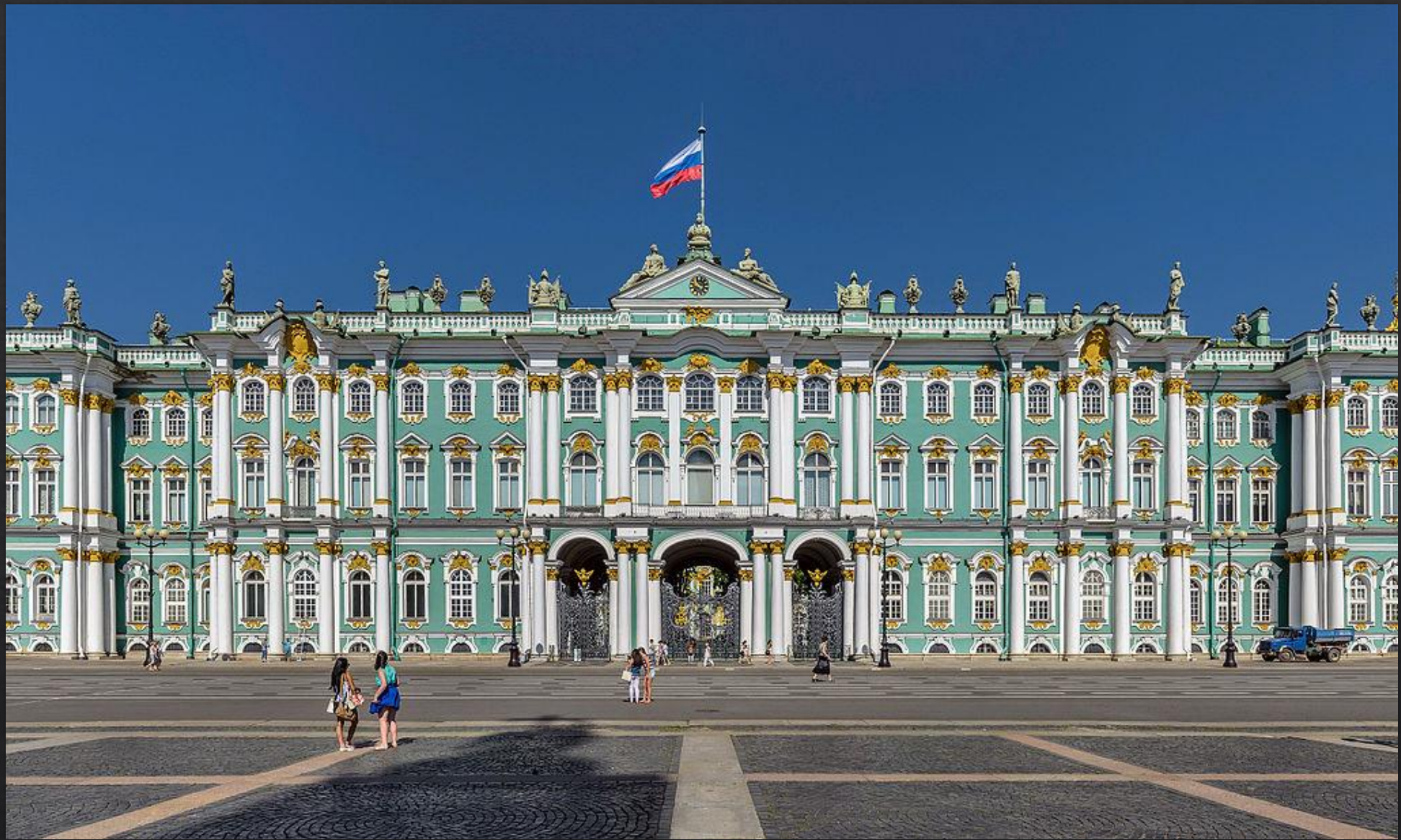
Зимовий палац сьогодні