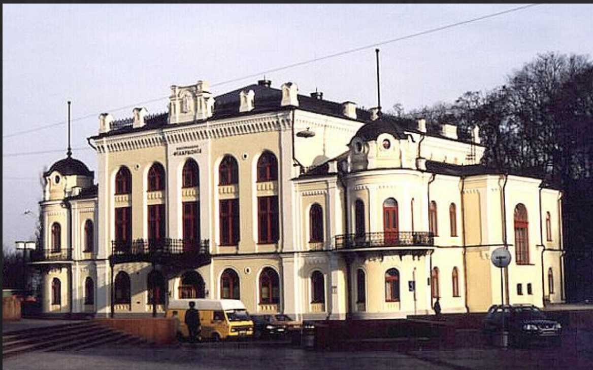
Будівля Національної філармонії

19 – 21 квітня в Києві проходив Український національний конгрес, в роботі якого взяли участь понад 900 осіб. На конгресі були представлені всі регіони України. У перший день конгресу було прийнято резолюцію про проголошення автономії України.