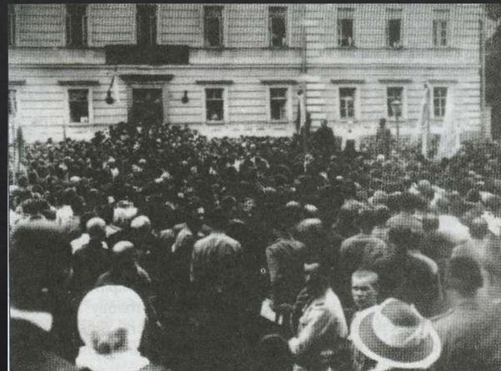
Учасники офіційних делегацій сходяться до зали засідань Конгресу