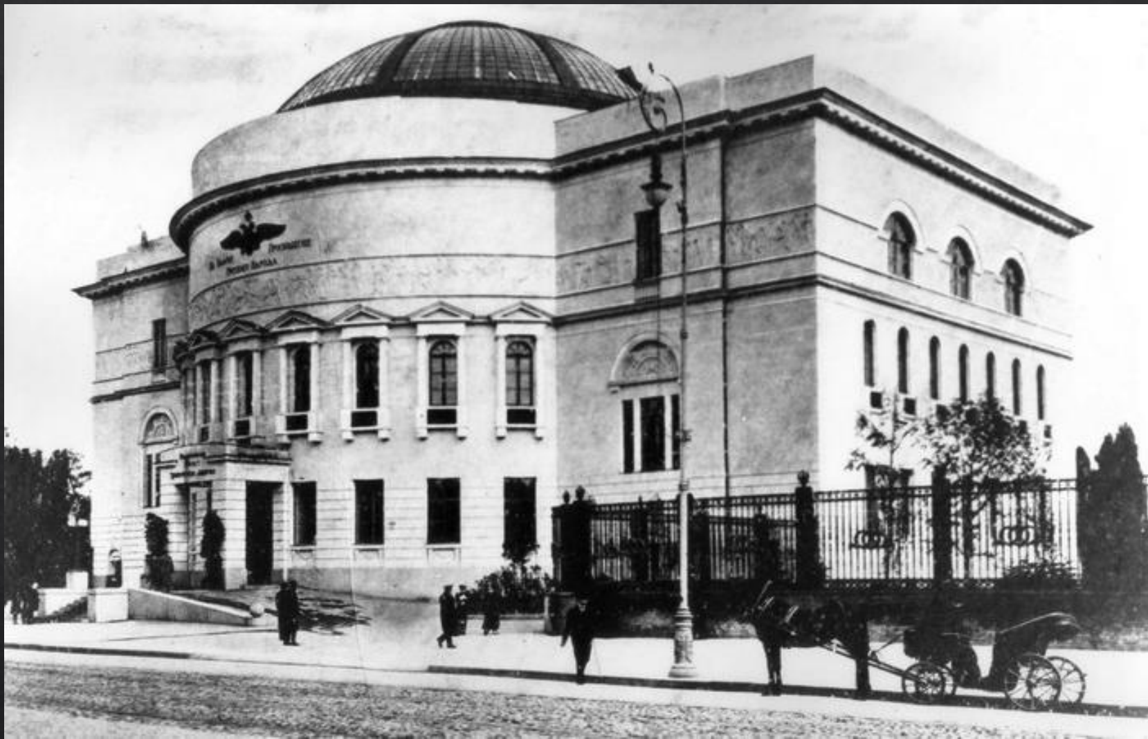
Педагогічний музей імені цесаревича Олексія 1909—1911 роки, де працювала Українська Центральна Рада. Фотографія 1911 року