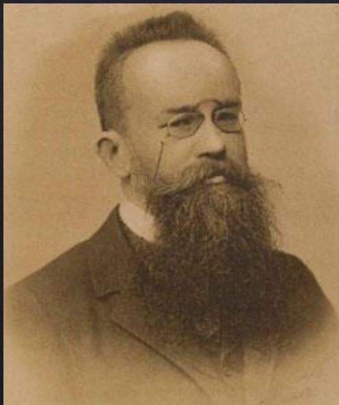
Голова Центральної Ради Михайло Сергійович Грушевський